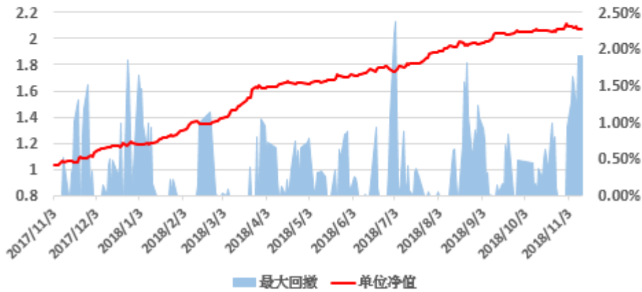
组合单位净值曲线